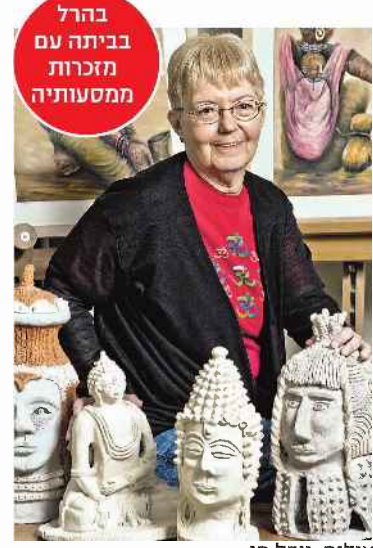
בהרל בביתה עם מזכרות ממסעותיה

היא גם אם לשני בנים וסבתא לחמישה. "כשהמוגבלות הפיזית נחתה עליי, הח' לטתי להתייחס אליה בריוק ככה: כאל מוגבלות פיזית בלבה למה שהיא תרכא את ההרפתקנות והסקרנות שלי לחקור? אני מאמינה שכוח רצון ונחישות הם המפתח להתמודדות, ובזכותם אפשר לנצח את המוגבלות". לא כולם בירכו. "חלק אמרו כל הכבוד, אבל אחרים אמרו 'השתגעתי? במצבך לטוס לקצה העולם?!' גם הרופא במרפאת המ' טיילים שבה התחסנתי לפני המסע להודו האשים אותי בחוסר אחריות. מאו הוא הבין את הראש שלי. כשאני מגיעה לשם היום הוא שואל מה היעד הנוכחי ומה היעד הבא". לפני כעשור נרשמה לטיולי נהיגה אתגריים, בעיקר באפריקה, שקשים גם לאנשים בריאים. "המליצו לי ליטול כרו' רים נגד מלריה, אבל כיוון שאני נוטלת הרבה תרופות, לא רציתי להעמיס עוד על הגוף. בבית מרקחת הומאופתי רקחו לי תרופה נגד כינין, הקפדתי לישון עם כילה נגד זבובים ויתושים, ונהנית מכל רגע". היא יוצאת לטיולים מאורגנים, אבל פעמים רבות ממשיכה לבד. "הטיול להודו לא כלל את אגרה, וזה שיגע אותי. לטייל בהודו בלי לראות את הטאג' מהאל, זה כמו להיות במצרים בלי לראות את הפירמי' דות. לא ויתרתי, ונשארתי עוד שלושה ימים לבד".